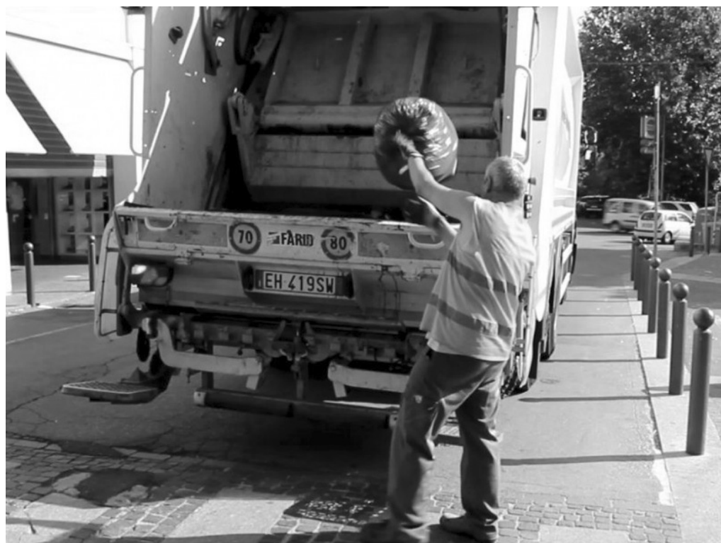
Fig. 3 – Esempio di raccolta di sacco per il rifiuto urbano residuo dotato di Tag Rid (Altares Srl).

Grazie quindi all’abbinamento sacco/anagrafica, ogni utente sarà riconosciuto attraverso un codice personale e pagherà in funzione del numero di volte in cui esporrà il sacco nero a bordo strada.